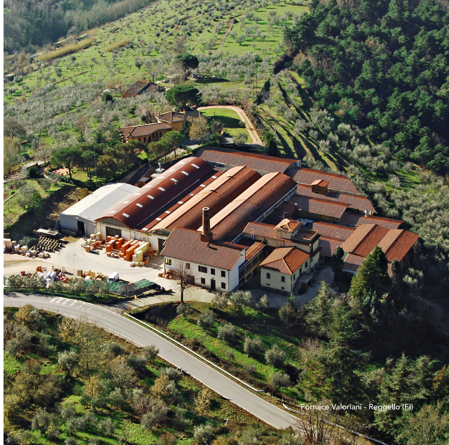
Fornace Valoriani - Reggello (FI)